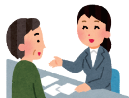
証明書発行業務の人員増強